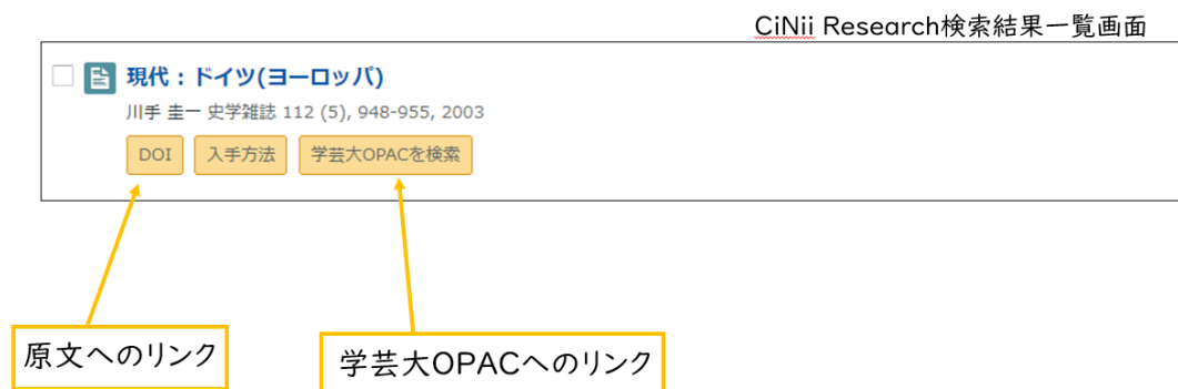
図 5 CiNii Research 検索結果画面②